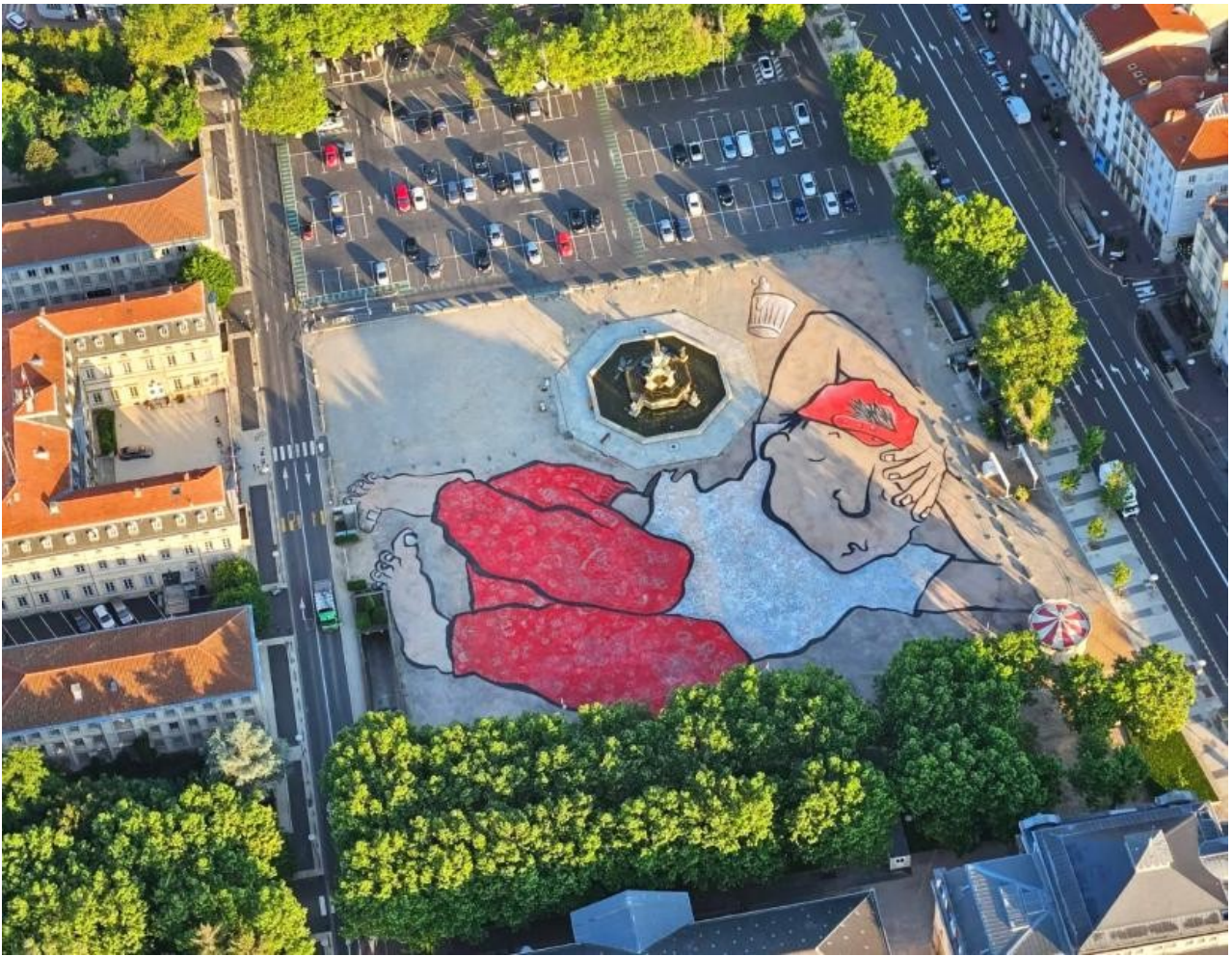
Dur de s'étirer entre les artères et les monuments de la ville.