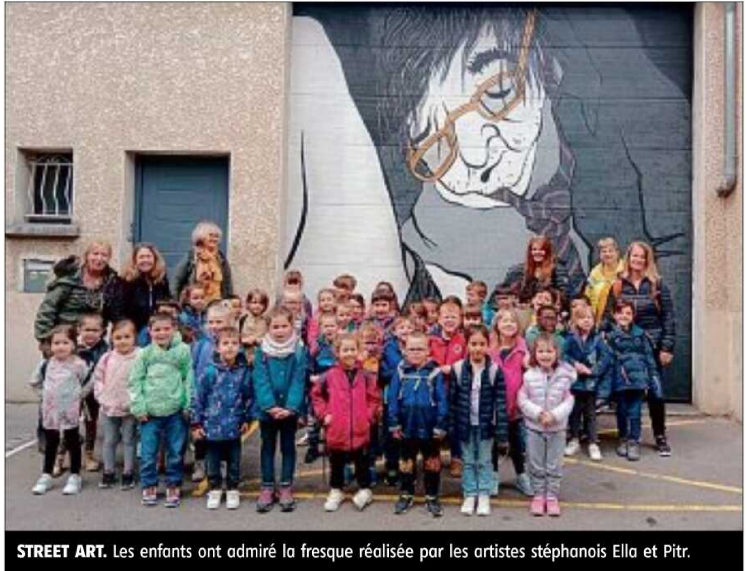
STREET ART. Les enfants ont admiré la fresque réalisée par les artistes stéphanois Ella et Pitr.

Inspirés par les œuvres d'Ella et Pitr, deux street artistes stéphanois, les élèves ont également préparé un géant endormi. Lors d'une sortie scolaire, les enfants de moyenne et grande section ont pu observer les personnages colossaux graphés par Ella et Pitr dans leur quartier de