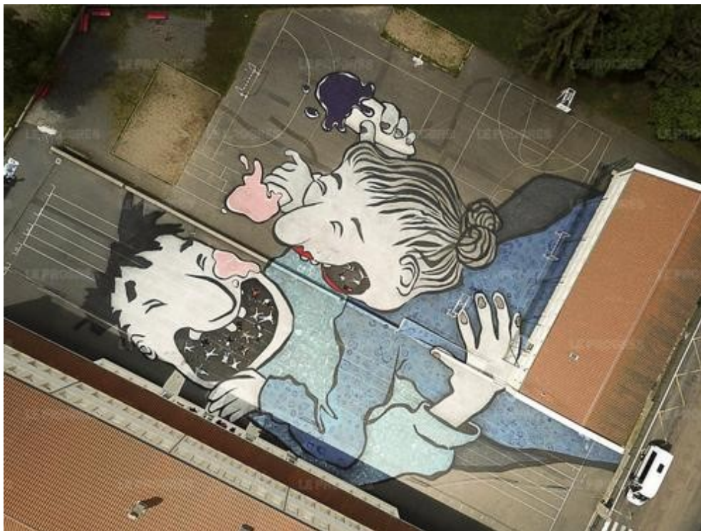
Un couple de géant s'amuse dans la cour du collège d'Allègre.

Pour fêter son quarantième anniversaire, l'Atelier des arts de la communauté d'agglomérations du Puy a, entre autres, convié deux artistes plasticiens pour une résidence sur le territoire de l'Agglo. Depuis le mois de mai, leurs œuvres ont vu le jour avec la collaboration de nombreux élèves de primaire, collégiens et de lycéens.