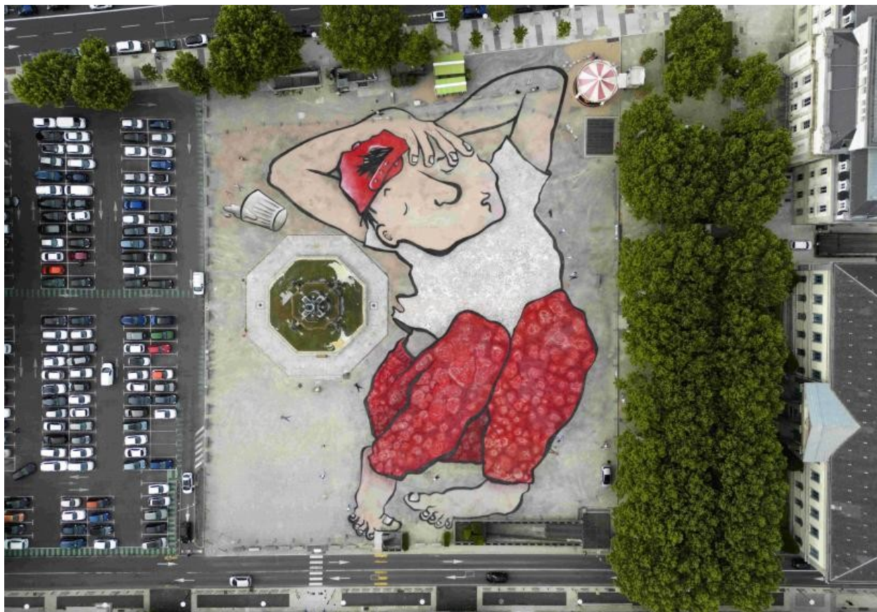
Le sommeil d'un colosse sur la place du Breuil. Photo par Ella & Pitr

Cette semaine, la place sablée du Puy-en-Velay a été le théâtre d'une étrange danse. Avec les artistes Ella & Pitr, 200 élèves en Art plastique du lycée Simone Weil et de l'Atelier des Arts ont mis leurs talents en commun pour constituer le personnage le plus gigantesque que la cité ponote ait porté.