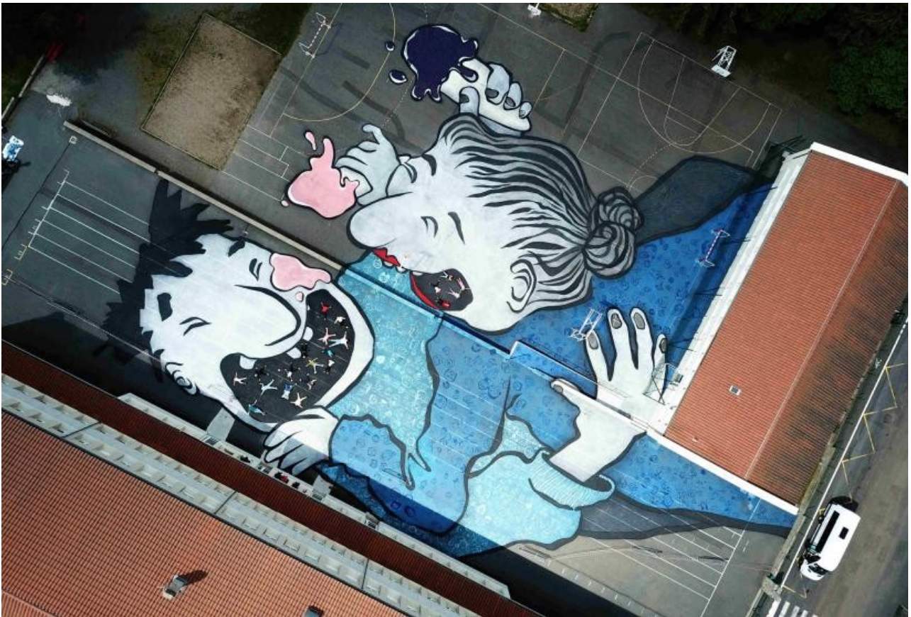
Allègre cache d'étranges personnages en son sein. Photo par Ella & Pitr