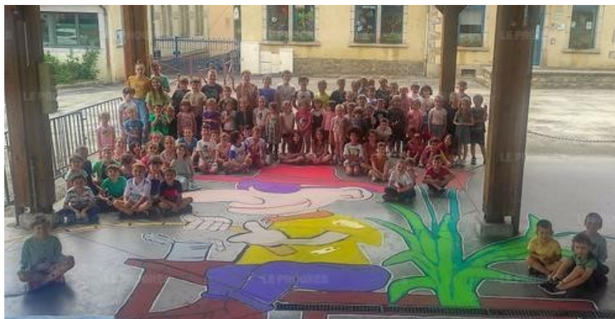
Le pêcheur colore désormais le sol de la halle.