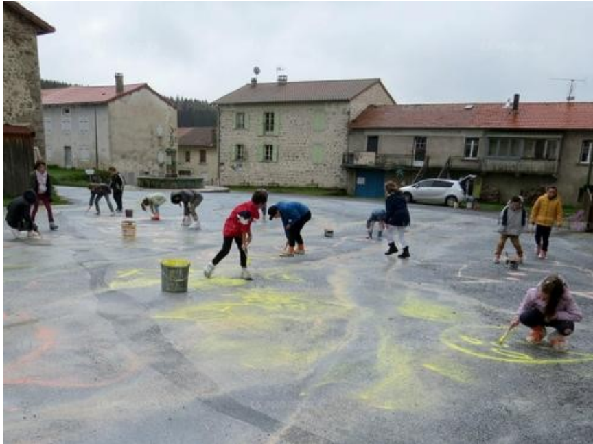
Répartis en différents groupes, les écoliers ont tenté de peindre la couette du géant. La pluie a apporté sa touche à cette œuvre monumentale dessinée dans les rues et places du Bourg par Ella & Pitr.

Ella & Pitr sont deux artistes stéphanois qui travaillent ensemble depuis 16 ans. Experts dans le monde de l'art urbain, ils peignent sur les murs, les sols et les toits. Depuis 2019, ils détiennent même le record de la plus grande œuvre figurative. Une fresque de 25 000 m 2 , peinte sur la toiture du Parc-Expo à Paris, intitulée Quel temps fera-t-il demain ?