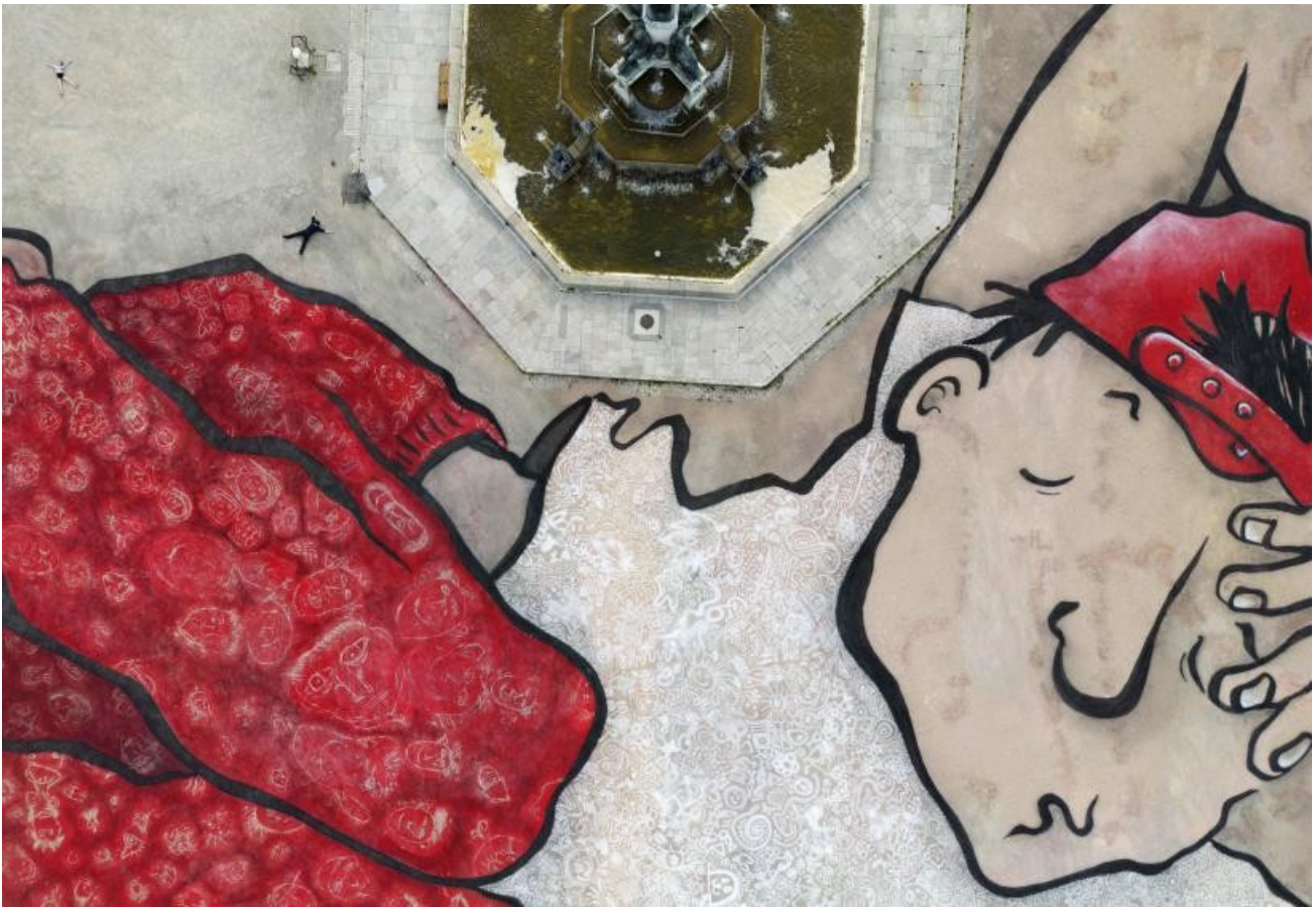
Les humains, petites fourmis qui évoluent autour du grand garçon. Photo par Ella & Pitr