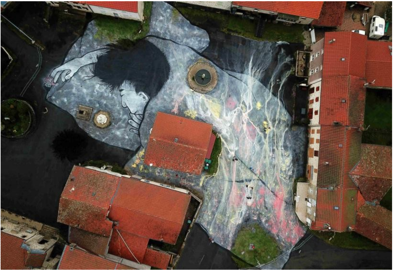
Dans le village de Félines, une vision étonnante... Photo par Ella & Pitr