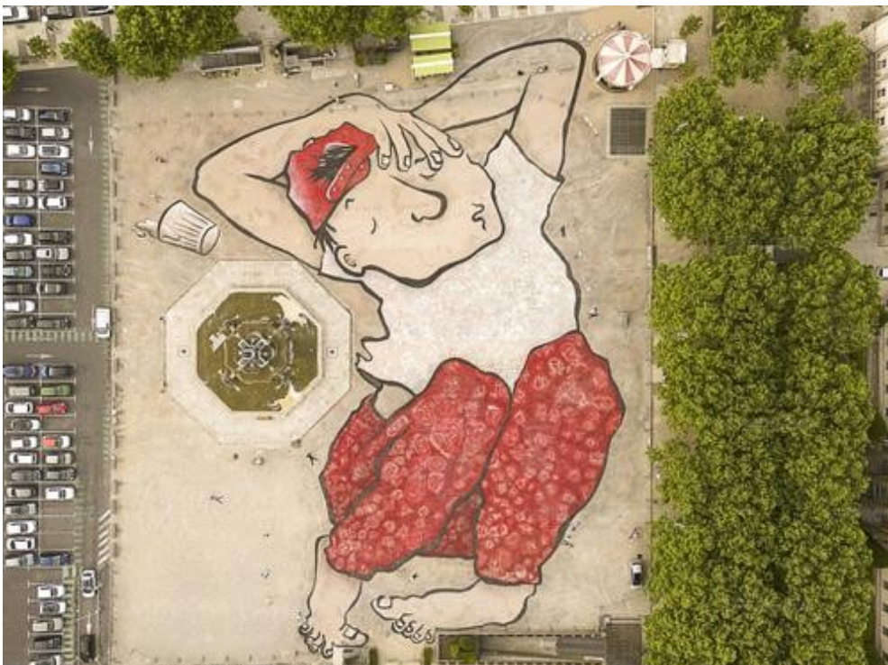
Le Géant endormi de la place du Breuil, au Puy peut être contemplé par le public.

Plus d'informations, et vidéos sur le site : www.ateliersdesarts.fr et sur le site des artistes : ellapitr.com .