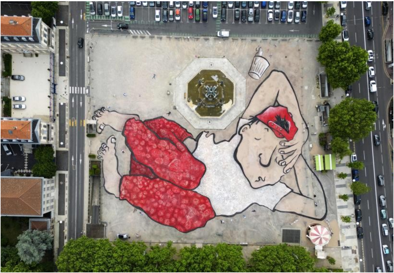
Le Géant du Puy s'en va doucement pour son dernier voyage.